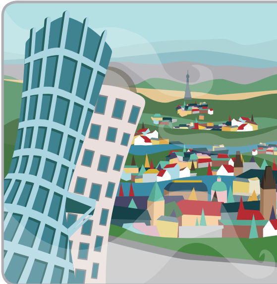
ILLUSTRATION BY LOCAL ARTIST KATEŘINA HUBENÁ