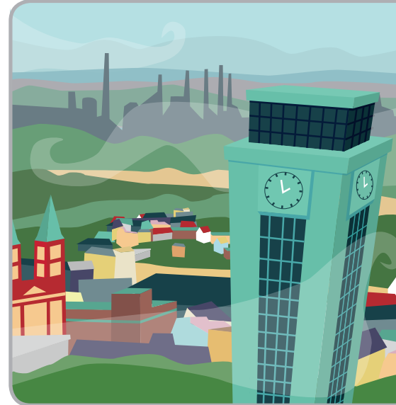
ILLUSTRATION BY LOCAL ARTIST KATEŘINA HUBENÁ