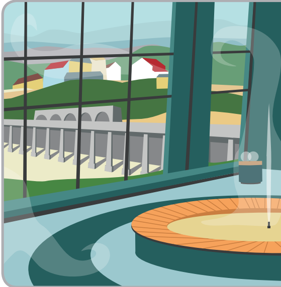
ILLUSTRATION BY LOCAL ARTIST KATEŘINA HUBENÁ