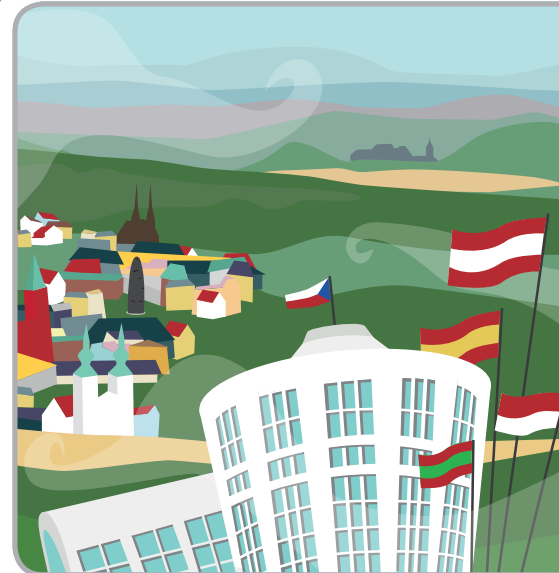
ILLUSTRATION BY LOCAL ARTIST KATEŘINA HUBENÁ